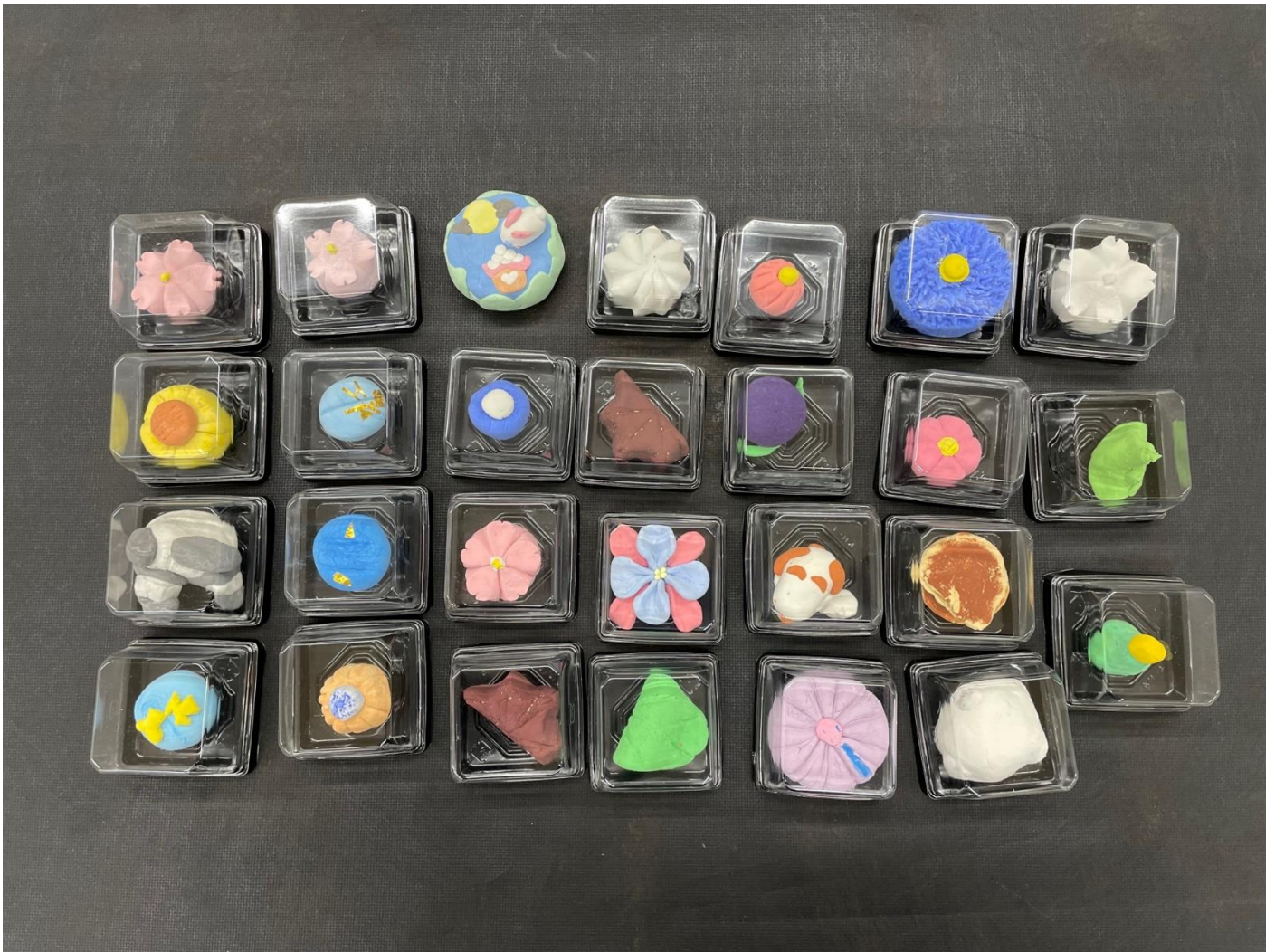
紙粘土を使って和菓子を作りました。