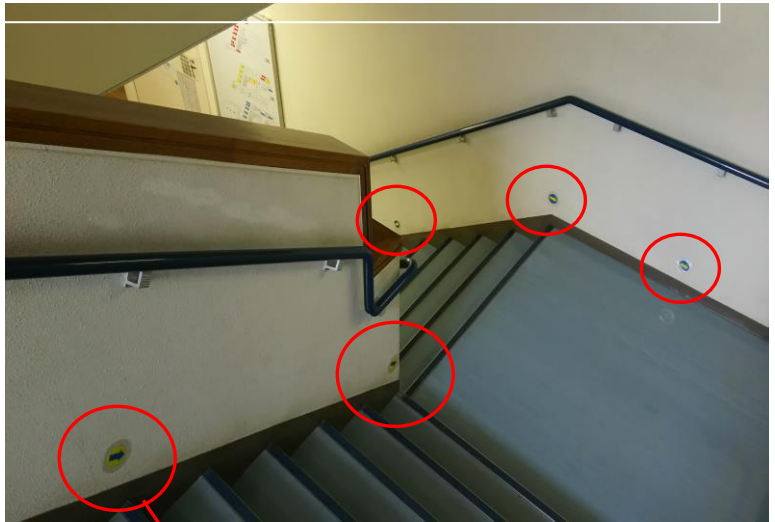
しゃしん かいだんひょうじ じょうきょう 【写真2：階段表示の状況その2】