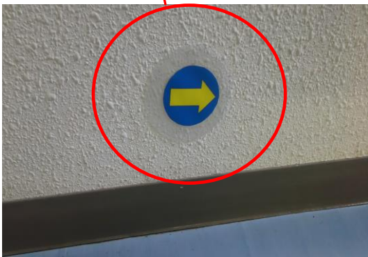
しゃしん ゆうどうようやじるし あおぢ きいろ 【写真3：誘導用矢印（青地に黄色）】