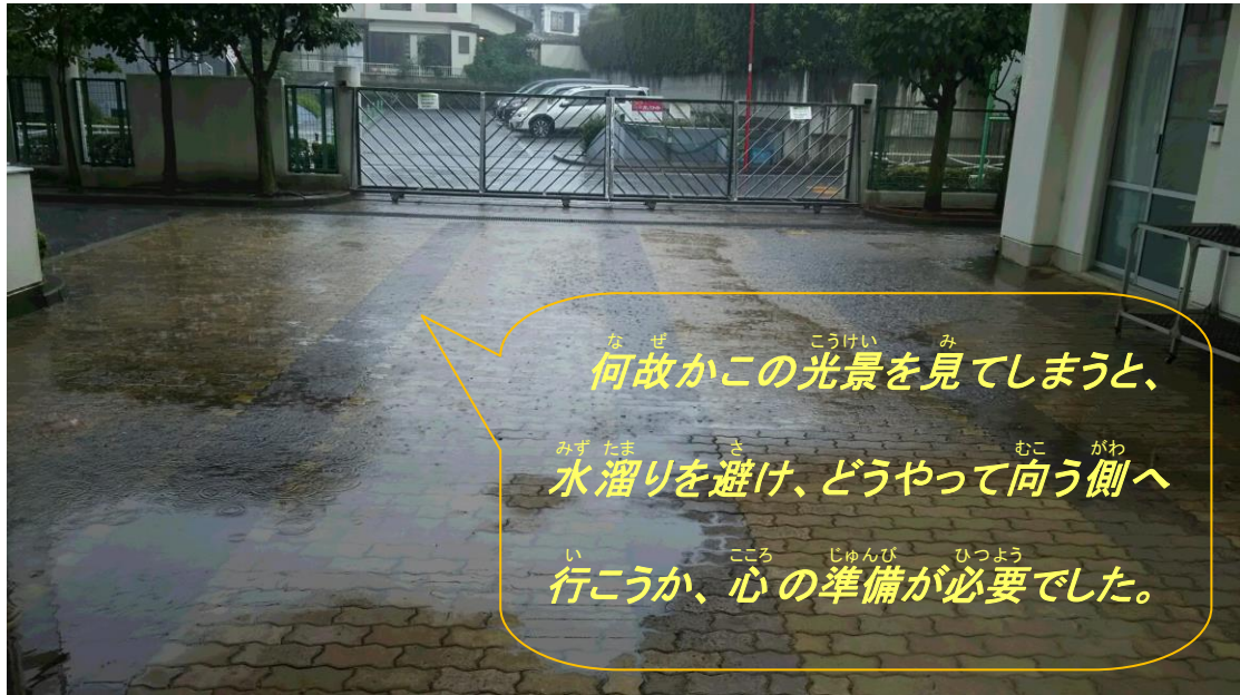
【写真1：舗装前の状況】