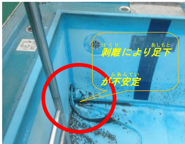
【写真1：旧 プール槽塗装状況】