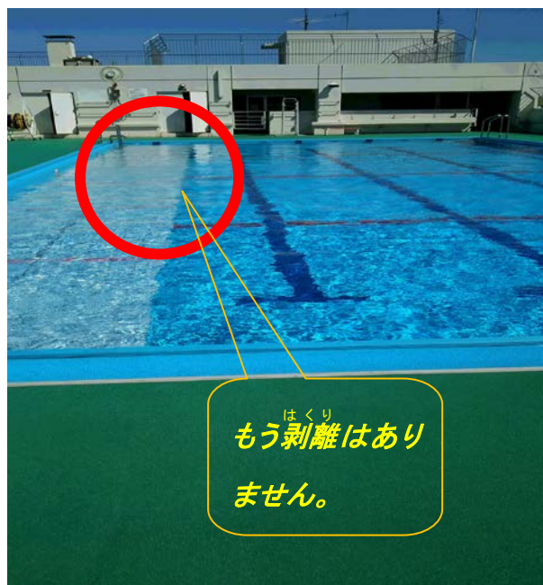
【写真3：新 プール槽塗装状況】